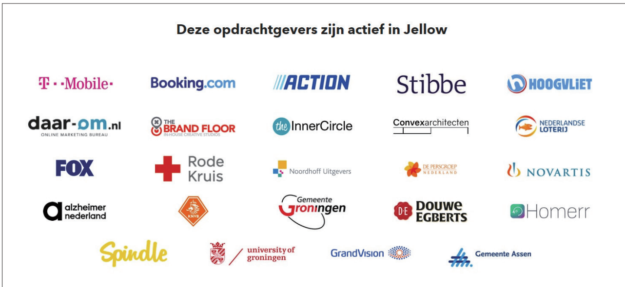
図表 11 Jellow のクライアント

オランダの労働力人口のおよそ12%がZZPで、欧州で7番目に多く、多くの企業がフリーランサーをうまく活用していると思われる。下記は前述の法人向けサービスを提供しているJellowのクライアント一覧である。